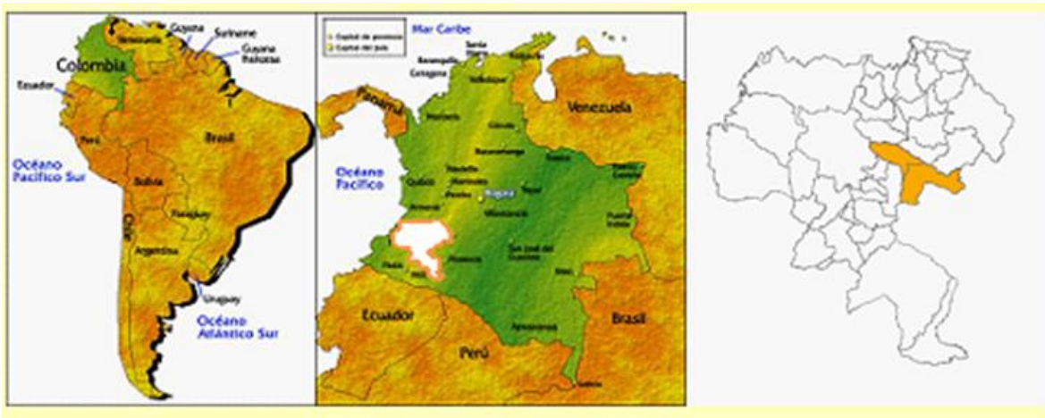
Mapa 1: Ubicación General del Programa Conjunto “Integración de eco-sistemas y adaptación al cambio Climático en el Macizo Colombiano”

Estas acciones específicas de adaptación, se orientan a disminuir los impactos de la variabilidad climática de sistemas de producción pecuaria predominantes, mejorar la seguridad y soberanía alimentaria de la población local, protección de ecosistemas, el abastecimiento de agua y la prevención de riesgos. De esta experiencia concreta se espera extraer elementos importantes para el enriquecimiento de las políticas de adaptación al cambio climático por una parte y por otra validar tecnologías concretas y metodologías de concertación entre actores sociales y entidades en el contexto de la elaboración y puesta en marcha de la ruta de transición para la adaptación al cambio climático, con visión amplia e integral.