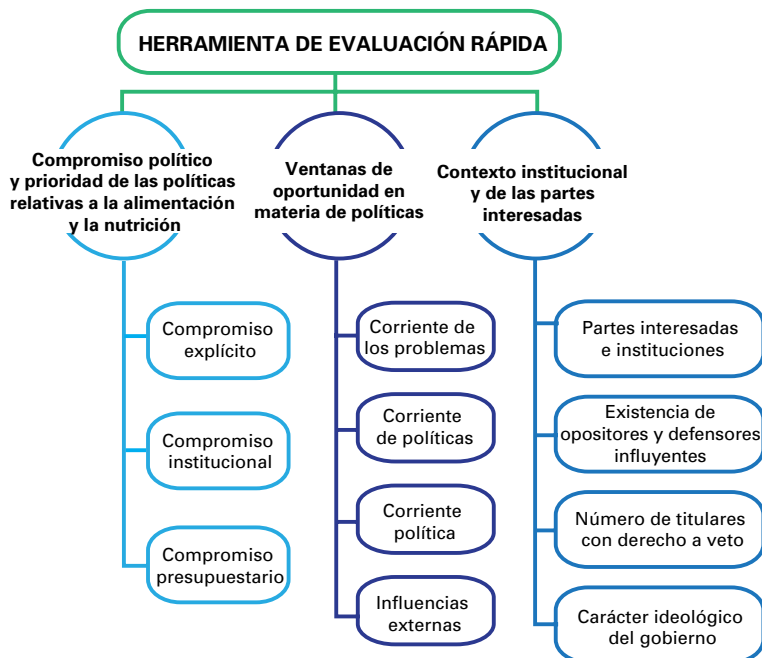
Recuadro 1 Esquema de la herramienta de evaluación rápida para medir el compromiso político y las oportunidades (PCOMRAT, por sus siglas en inglés)

Basada en la teoría de Kingdon (2003) sobre el establecimiento de un programa, la herramienta identifica tres factores o “corrientes” que influyen en la determinación del programa gubernamental. Kingdon define un programa como una lista de temas o problemas a los cuales los funcionarios del gobierno prestan especial atención en un momento dado (pág. 3). Él sostiene que, cuando las tres corrientes convergen, se abre una ventana de oportunidad para promover un tema (por ejemplo, los alimentos y la nutrición) en los programas de los gobiernos (Recuadro 2).